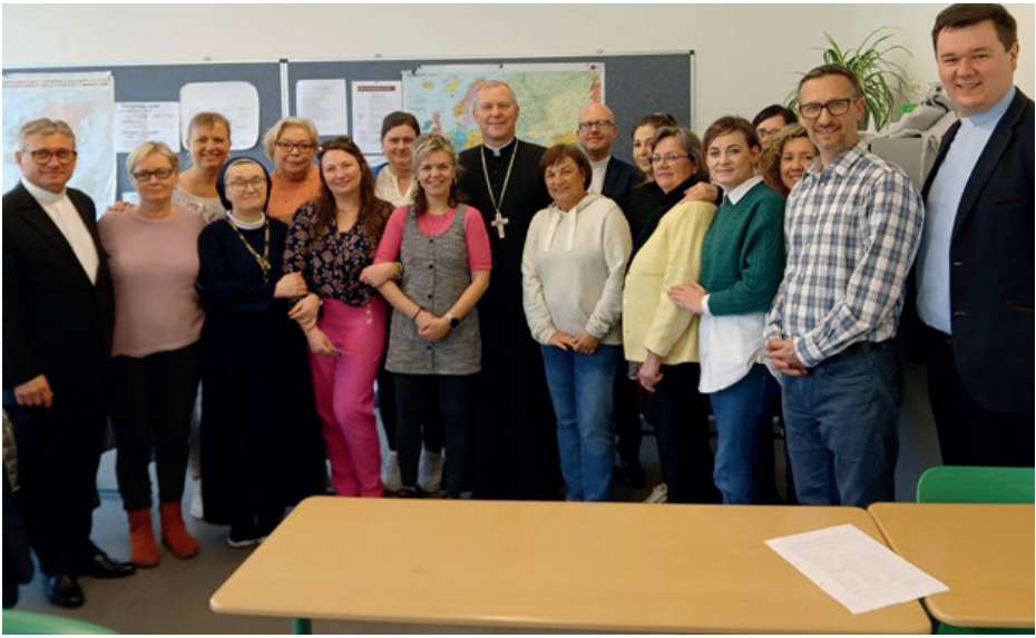
Bierzmowanie w naszej Misji